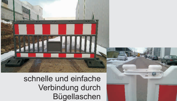
schnelle und einfache Verbindung durch Bügelassen

certified according to German norm TL 97 for safety fences